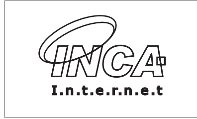
외곽선만 사용하면 안됩니다.